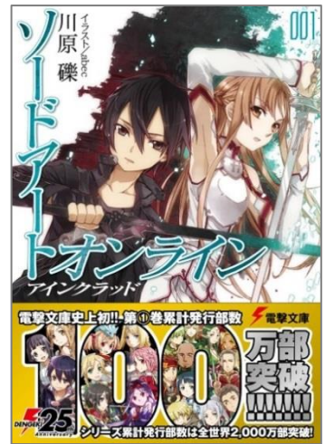
『ソードアート・オンライン』第1巻表紙

現在までシリーズ23冊を刊行、さまざまなエピソードで展開する独創的なストーリーは、日本国内だけにとどまらず海外でも高い人気を誇る電撃文庫の大ヒット作品です。小説の発行部数は全世界累計2,000万部を突破、第1巻の単巻発行数は100万部を超えています。2度のTVアニメ化やゲーム化、コミカライズ、グッズ製作、スピンオフ小説の刊行など、幅広いメディア展開を行っており、現在、原作者・川原 礫氏による完全新作書き下ろしストーリーの劇場版アニメ『劇場版 ソードアート・オンライン -オーディナル・スケール-』が公開中、大ヒットとなっているほか、ハリウッドにて実写映像化企画も進行しております。