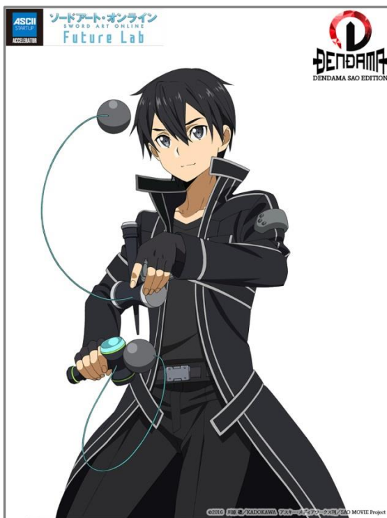
「電玉 SAO EDITION」イメージビジュアル ※画像は現在制作中のものであります。