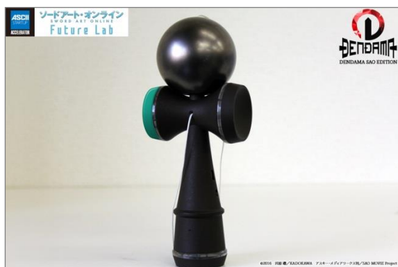
「電玉 SAO EDITION」イメージ