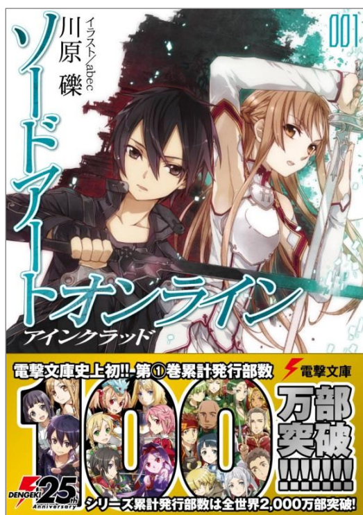
↑ 『ソードアート・オンライン』第1巻表紙

株式会社KADOKAWA(本社:東京都千代田区、代表取締役社長:松原眞樹)アスキー・メディアワークスでは、エンターテインメントノベル「電撃文庫」より小説『ソードアート・オンライン』シリーズ(著/川原 礫、イラスト/abec)を2009年4月から刊行しております。このたび、シリーズの第1巻である『ソードアート・オンライン1 アインクラッド』の単巻発行部数が4月25日(火)の増刷発行分をもって100万部を突破、さらに、全世界累計発行部数も2,000万部を突破※いたしますのでお知らせいたします。