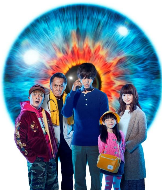
『視覚探偵 日暮旅人』イメージ

小説『探偵・日暮旅人』シリーズは、匂い、味、感触、温度、重さ、痛みなど“目に見えないモノ”を視る力を持ち、探し物専門の探偵事務所を営む探偵・日暮旅人(ひぐらし たびと)が「愛」を探す物語です。本作は、2010年9月にシリーズ第1弾となる『探偵・日暮旅人の探し物』を刊行。探偵・日暮旅人と、さまざまな登場人物たちが織りなす人間模様が深い感動を呼び、現在シリーズ9冊を刊行、累計発行部数50万部を超えるベストセラーとなっています。12月22日(木)には、シリーズ最新第10弾『探偵・日暮旅人の残り物』を刊行予定です。