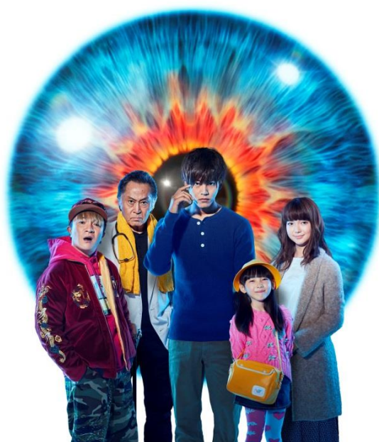
『視覚探偵 日暮旅人』イメージ

小説『探偵・日暮旅人』シリーズは、匂い、味、感触、温度、重さ、痛みなど“目に見えないモノ”を視る力を持ち、探し物専門の探偵事務所を営む探偵・日暮旅人(ひぐらし たびと)が「愛」を探す物語です。本作は、2010年9月にシリーズ第1弾となる『探偵・日暮旅人の探し物』を刊行。探偵・日暮旅人と、さまざまな登場人物たちが織りなす人間模様が深い感動を呼び、現在シリーズ9冊を刊行、累計発行部数50万部を超えるベストセラーとなっています。12月22日(木)には、シリーズ最新第10弾『探偵・日暮旅人の残り物』を刊行予定です。