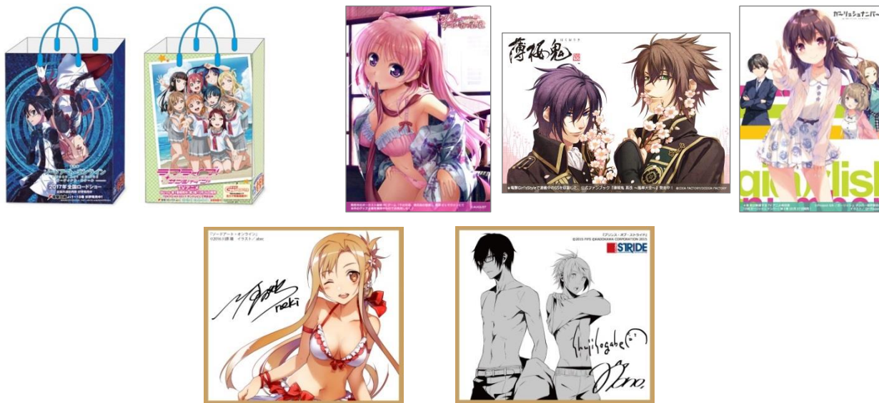
上段左から：ショッパー、プロマイド、下段：サインミニ色紙のイメージ画像