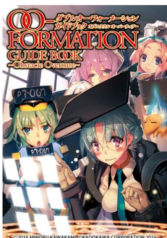
↑ ガイドブック表紙イメージ

電撃の公式オンラインストア「電撃屋」にて、7月15日(金)～26日(火)まで予約受付中です。