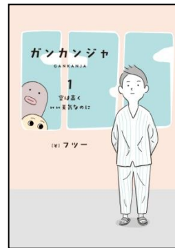
← 『ガンカンジャ 1』 表紙(帯なし)