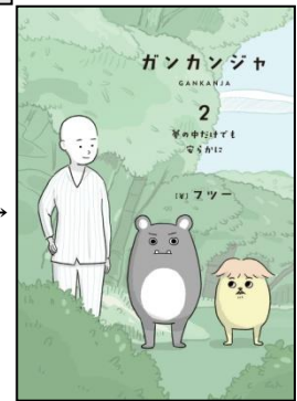
『ガンカンジャ 2』→ 表紙(帯なし)