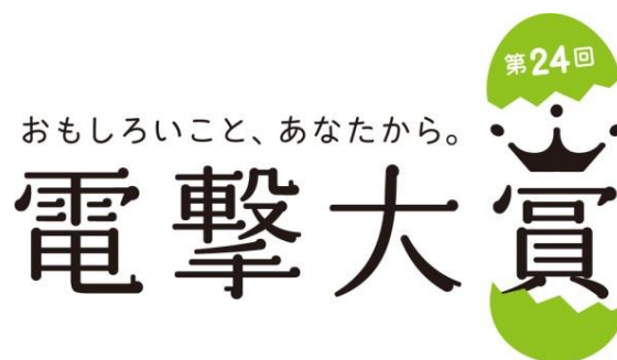
↑ 第24回電撃大賞ロゴ

締め切り後、小説部門は1次~4次、イラスト・コミック部門は1~3次の選考を行い、最終候補作を選出。2017年9月に、最終選考委員により大賞および各賞の受賞作品を決定。