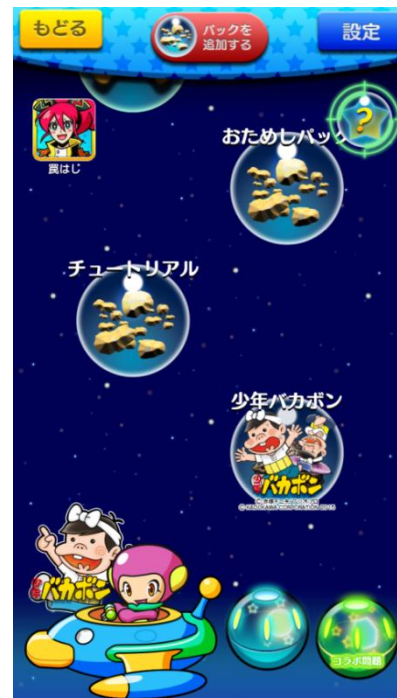
↑ ゲーム画面イメージ