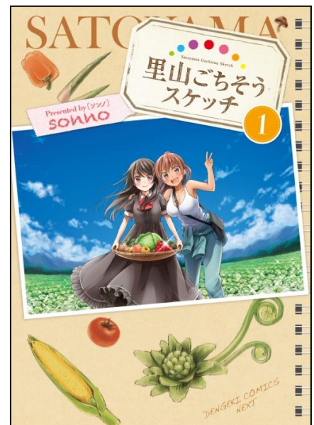
↑『里山ごちそうスケッチ』①表紙

都会から里山に引っ越してきたコミュ障気味の画家・杏(あんず)。脳内で食べ物を女の子に擬人化してしまう彼女の料理には、刺激的な“可愛さ”が満ち溢れていた……!! ニヤニヤ、びっくり、時々ほっこり、里山お料理らいふ★