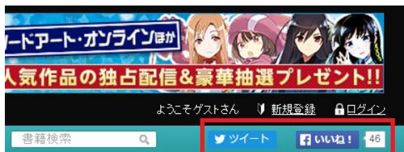
↑ 「SNS投稿ボタン」イメージ

※スコア獲得方法の詳細については、電撃文庫公式サイト 「電撃文庫CLUBとは?」( http://dengekibunko.jp/club/ )をご覧ください。