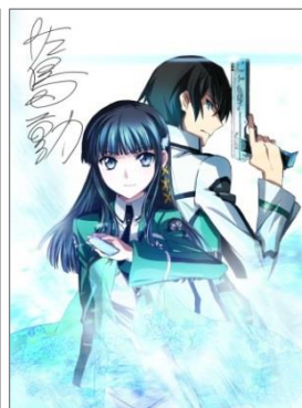
↑ 著者直筆サイン入り複製原画 イメージ