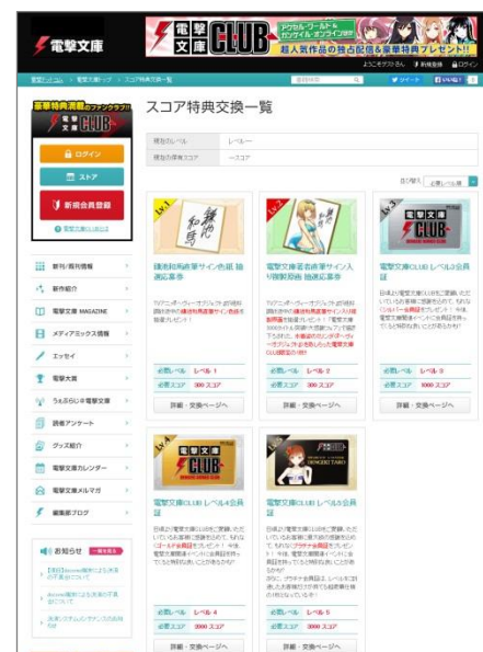
↑ スコア特典交換一覧ページ イメージ