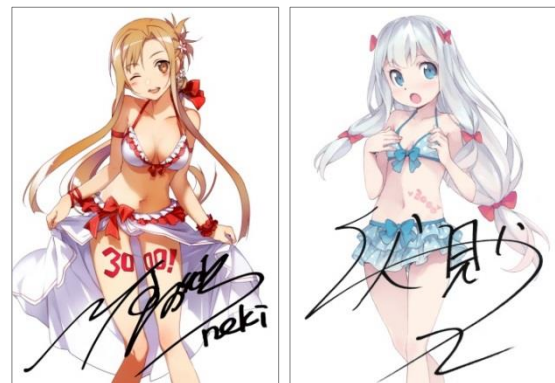
↑ 著者直筆サイン入り複製原画 イメージ画像

●電撃文庫3000タイトル突破!!大感謝フェア 公式サイト: http://dengekibunko.jp/3000/