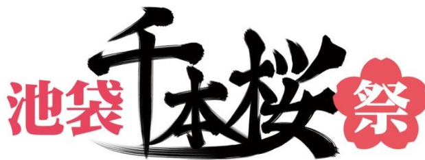
↑「池袋 千本桜祭」ロゴ

『小説 千本桜 参』が発売となる3月7日(土)から、「ミクの日」である3月9日(月)まで、東京・池袋のアニメイト池袋本店9階にて、発売記念イベントを開催いたします。原作曲『千本桜』や小説に使用した美しいイラスト展をはじめ、映像上映、関連商品展示、新作グッズ先行販売に加え商品購入で特製クジがもらえるなど、『千本桜』の世界を楽しんでいただける内容となっております。