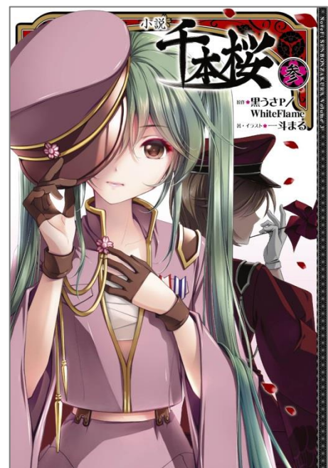
↑ 『小説 千本桜 参』表紙

原作曲『千本桜』は、黒うさP氏が2011年9月にニコニコ動画にて発表。黒うさP氏本人が制作したプロモーション動画(イラスト:一斗まる、動画:三重の人)はニコニコ動画上で850万再生を記録し、今なお、その再生数を伸ばしています。発表から3年以上を経た現在も、各カラオケランキング上位の常連となり、多くの有名アーティストが楽曲をカバーするなど、いまや“国民的ボカロ曲”と呼ばれています。