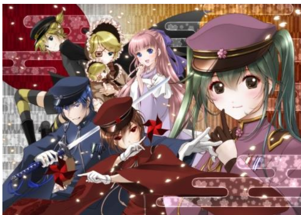
↑「池袋 千本桜祭」メインビジュアル