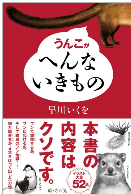
↑ 『うんこがへんないきもの』表紙

【書名】 うんこがへんないきもの 【著者】 早川いくを 【イラスト】 寺西 晃 【判型】 四六判 【ページ数】 242ページ 【定価】 本体1,430円＋税 【ISBN】 978-4-04-886442-8 【発行】 株式会社KADOKAWA 【プロデュース】 アスキー・メディアワークス 【書店発売日】 2014年12月5日（金）