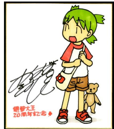
↑ A賞: 作家サイン入りイラスト色紙イメージ