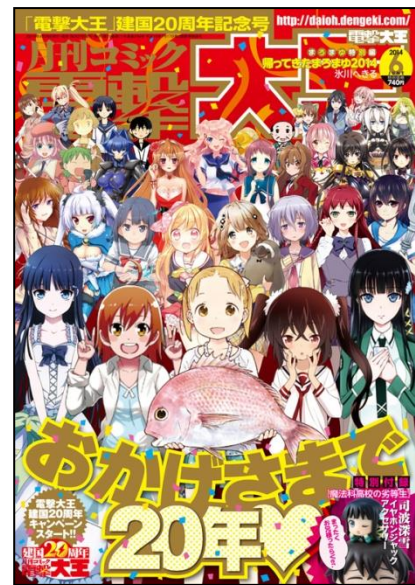
↑「月刊コミック電撃大王」 2014年6月号(4/26発売)表紙

すべてのコンテンツファンに贈る、最強コミックマガジン「月刊コミック電撃大王」20周年にご注目ください。