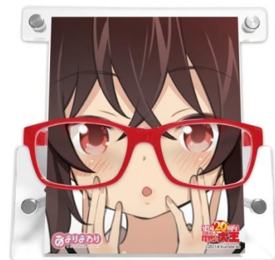
↑ 電撃大王建国20周年 グラススタンド[ガールズ]