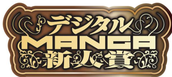
↑ 「デジタルMANGA新人賞」ロゴ

← 第2回デジタルMANGA新人賞イメージイラスト イラスト/しよた こん『Re:魔法少女』