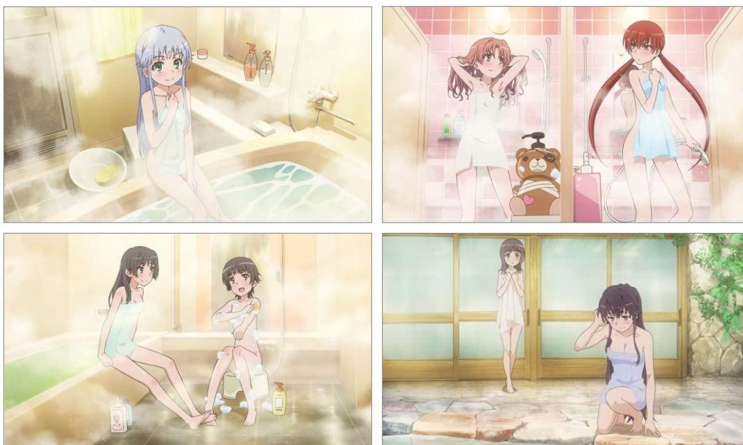
↑描き下ろしカードイメージ