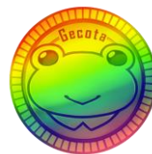
↑ゲコ太メダルイメージ