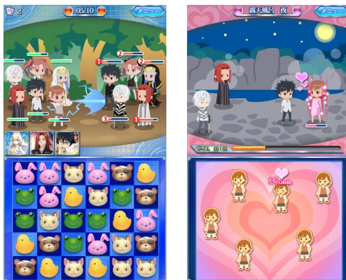
↑ゲーム画面イメージ